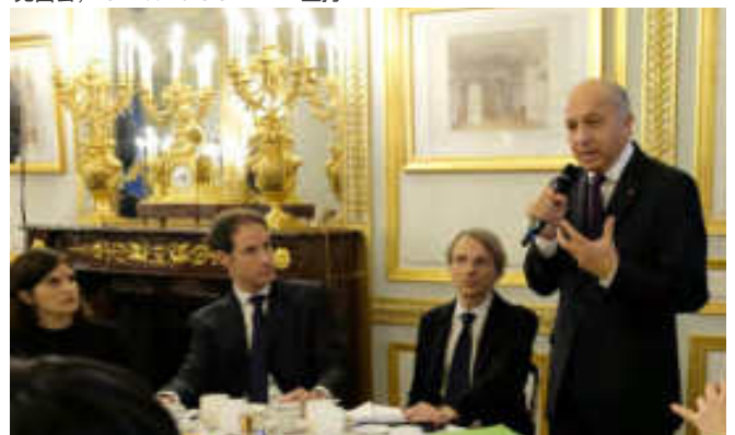
La France et la Chine face au défi climatique, autour de Laurent FABIUS, Président du Conseil Constitutionnel 议题: 法中两国共同面对气候挑战。与宪法委员会主席洛朗·法比尤斯。