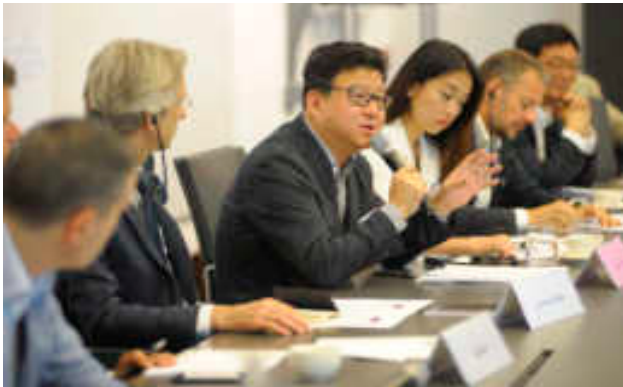
DING Lei, Fondateur et PDG, NetEase Inc. pionnier de l'internet 丁磊, 中国互联网领导者网易创始人兼首席执行官

Enfin, la promotion YL 2017 a eu le privilège d'être présentée à Edouard PHILIPPE, Premier ministre et YL 2013 à l'occasion d'un cocktail organisé à l'Hôtel Matignon.