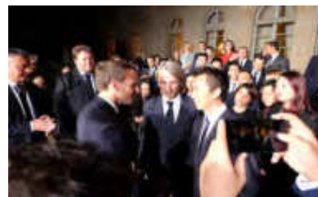
Clôture du séminaire Young Leaders à l'Élysée avec Emmanuel MACRON