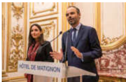
Réception de la promo Young Leaders 2017 par Edouard PHILIPPE à l'Hôtel Matignon

我们的中方官方合作伙伴是中国人民外交学会，学会在国际重大问题探讨及中外高层交流活动的组织方面扮演着重要角色。