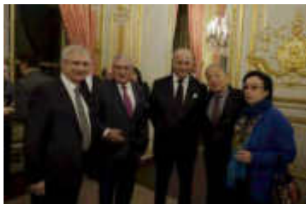
Claude BARTOLONE, Jean-Pierre RAFARRIN et Laurent FABIUS en compagnie de LI Zhaoxing et son épouse